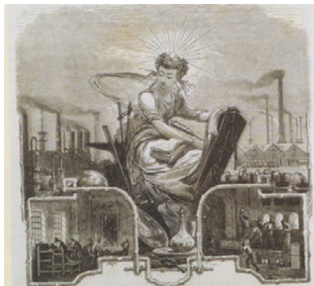
Ilustração do livro de Louis Figuier Les Merveilles de l'Industrie (4 vols., 1873-1877)

Já o positivismo, herdeiro das Luzes, empenhou-se em valorizar o progresso científico, enquadrando-o numa visão optimista do mundo, de base racional: a fé no desenvolvimento científico, em que assenta a ‘filosofia’ positiva, supunha uma evolução paralela da organização social, orientada para o bem-estar dos cidadãos. O homem perdia um certo sentido de harmonia com o mundo, mas em contrapartida tornava-se agente do seu destino colectivo, sujeito da História.