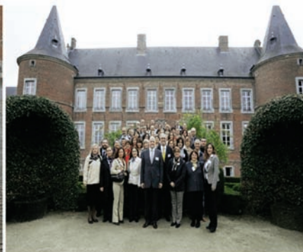
Imagens da convenção que celebrou o 10º aniversário do programa TrainMiC®